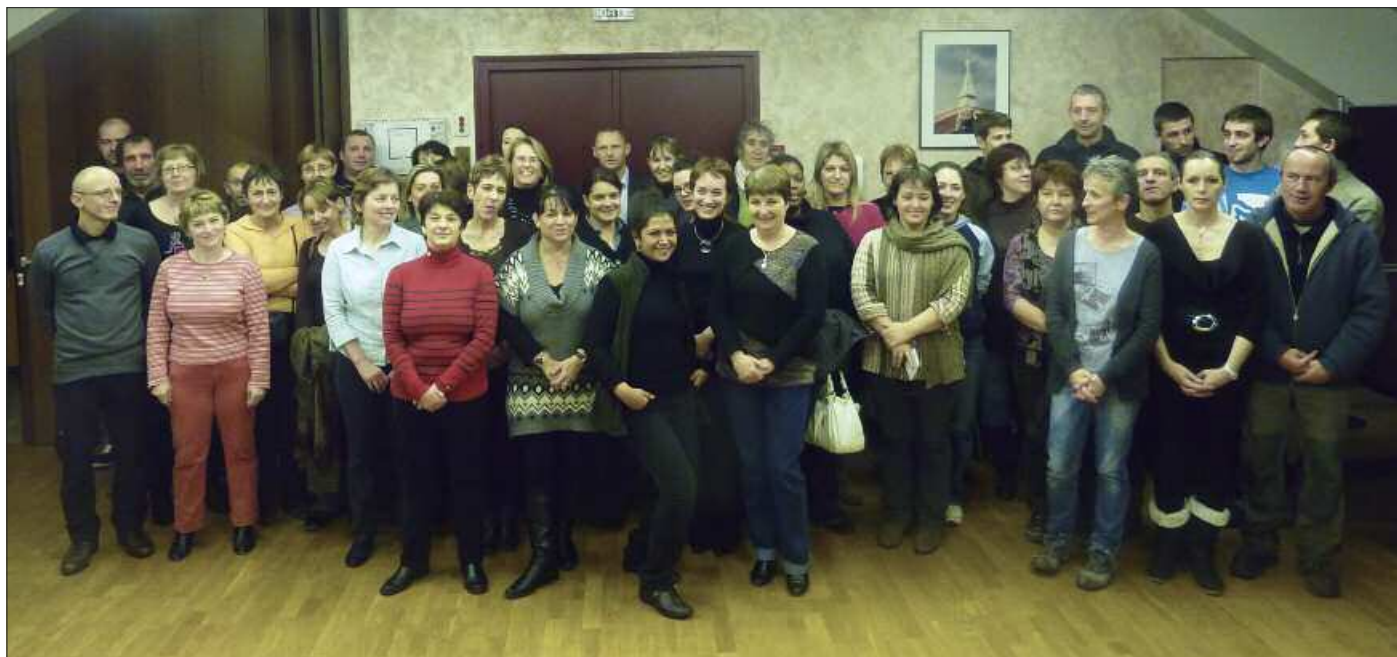
Le personnel communal, presque au grand complet, rassemblé en mairie, à l'occasion des vœux de l'exécutif : ce sont 59* personnes qui oeuvrent dans les services administratifs, les services techniques, les écoles... * 48 équivalents temps plein (voir aussi en page 4).