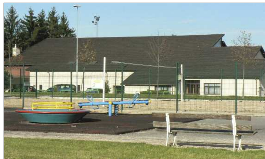
Pour les élections de 2012, la commune comportera comme les années précédentes trois bureaux de vote, tous installés dans la salle G. Laverrière à Véségnin.

Cette population est de toute évidence inférieure à la population réelle : la population recensée au 1 er janvier 2010 était déjà de 5980 habitants. Cela est dû au mode de calcul adopté sur l'ensemble du territoire, puisque, afin d'assurer une égalité de traitement entre toutes les communes françaises, la référence de base est celle de 2009.