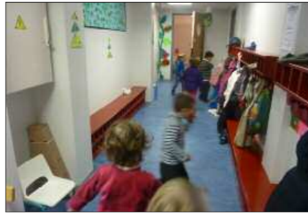
Les travaux d'agrandissement et de rénovation sont terminés à l'école des Grands Chênes. Le restaurant scolaire y a beaucoup gagné en confort ; plus spacieux, il est également moins sonore.

A l'école de la Bretonnière, suite à l'accord donné par l'Inspection Académique pour ouvrir une 13 ème classe, l'équipe enseignante a préféré attendre la rentrée de janvier, afin de perturber le moins possible les élèves et