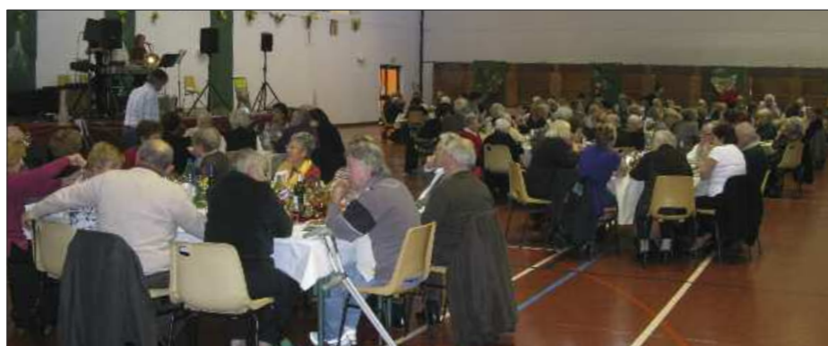
Le repas de Noël près de 150 personnes... et une centaine de colis.