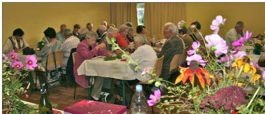
Le loto des aînés : une cinquantaine (en octobre, pendant la semaine bleue)

Les cours d'informatique ont recommencé pour 34 inscrits (3 groupes) et pendant six semaines.