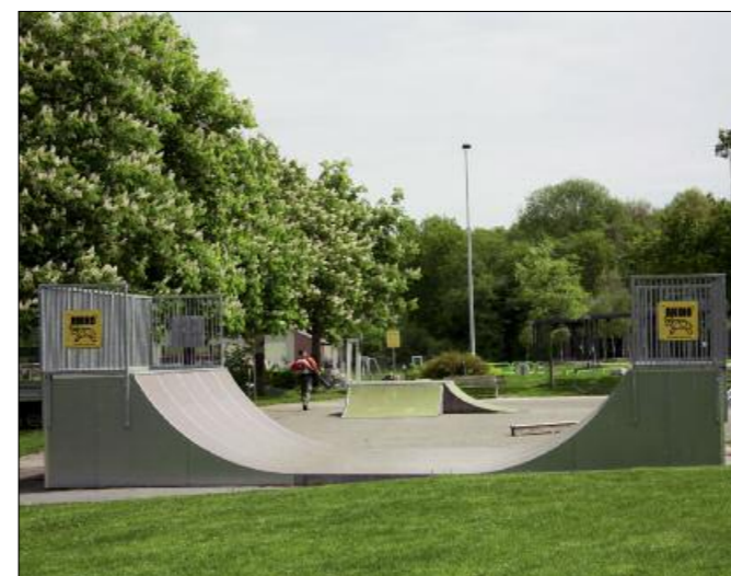
Le parcours sportif du château, le half pipe du skate parc, deux réalisations initiées par les CMJ.