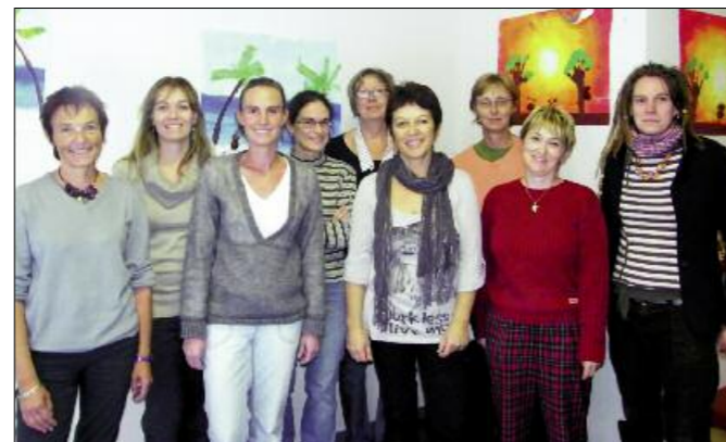
L'ensemble de l'équipe éducative de la Maternelle des Grands Chênes.