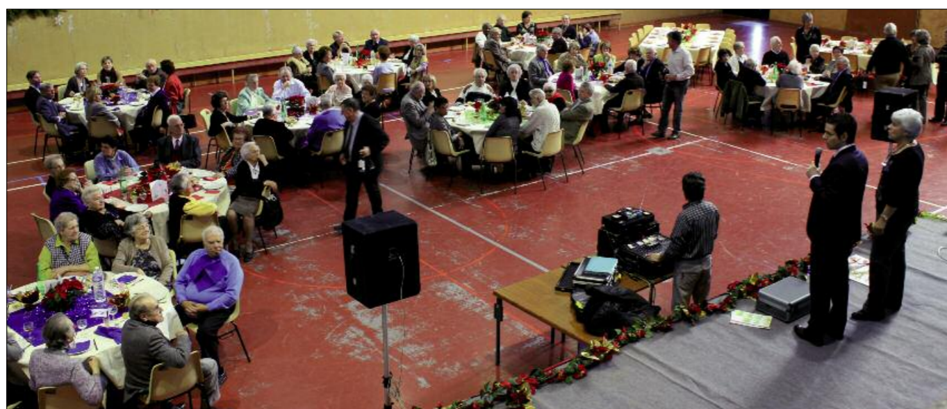
Repas de Noël : une partie des 140 convives ravis de leur journée le 12 décembre.