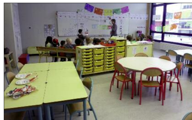
Les écoles, priorité budgétaire de 2011.

En matière de dépenses l'augmentation de la population induit une demande de services toujours plus grande. Sur le plan de l'investissement, les écoles restent la priorité ; viennent ensuite les aménagements pour la nouvelle ligne de transport public (ligne « O »), l'amélioration de la qualité environnementale de la commune et des aménagements sécuritaires indispensables.