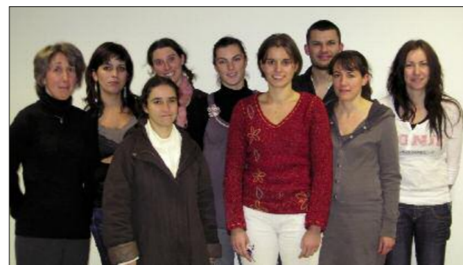
L'équipe pédagogique de l'Ecole de la Bretonnière.