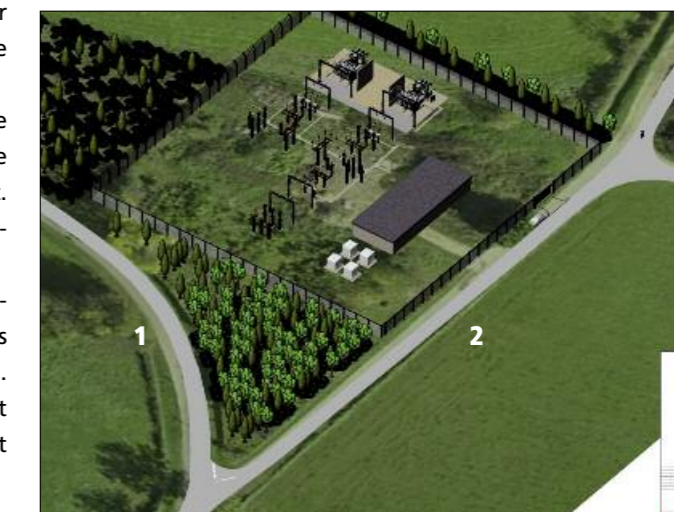
1 chemin des Tattes du Moulin - 2 le chemin des Tattes