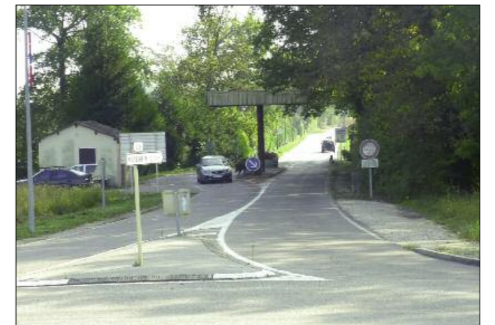
La route de Mategnin (route de Préveissin en Suisse) se trouve entre deux zones de marais écologiquement intéressants.

Retrouvez l'intégralité des comptes rendus sur : www.preveissin-moens.fr