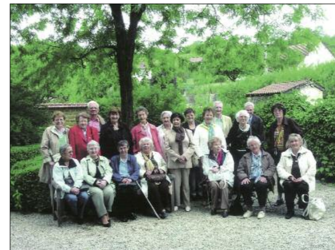
Dans le jardin de la maison de Pasteur.

« Avec les amis, la vie est multipliée, chacun ne vit pas uniquement sa propre vie, mais participe aussi à celle de ses amis. »