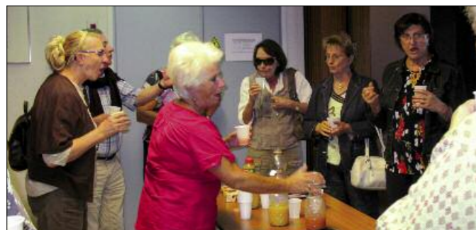
Retrouvailles des participants au séjour 2010, autour d'un verre pour échanger photos et souvenirs.

Séjour de vacances : vous avez 60 ans ou plus et vous souhaitez partir quelques jours pour un prix modique. Le CCAS avec le chèque vacances ANCV prévoit d'organiser un séjour au printemps 2011. Contactez dès à présent le secrétariat du CCAS pour vous faire connaître !