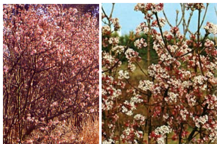
● Viburnum x bodnantense