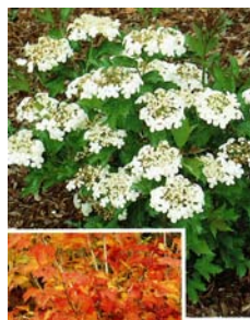
● Viburnum opulus