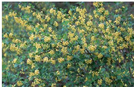
● Ribes odoratum