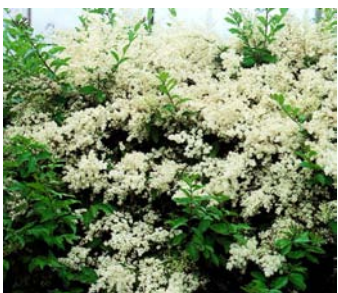
● Ligustrum sinense