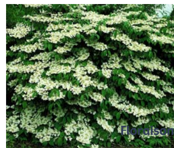
● Viburnum plicatum