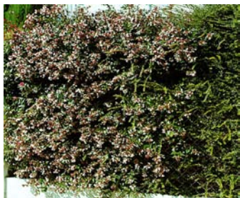
● Abelia X grandiflora