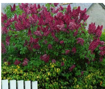
● Syringa vulgaris